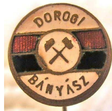
Klubcímeres jelvény 1955-ből